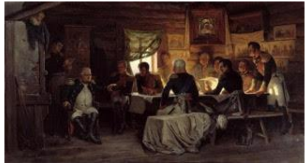
Maleri af den russiske hærledelse under Napoleonskrigene